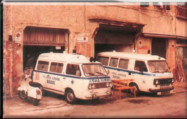
Ventiquattro anni fa