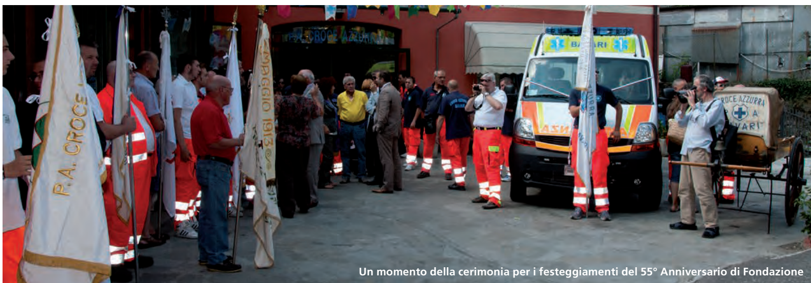
Un momento della cerimonia per i festeggiamenti del 55° Anniversario di Fondazione

A conclusione della premiazione, alla quale hanno preso parte numerosi concittadini, la Croce Azzurra ha offerto ai partecipanti e alle molte consorelle intervenute un po' da tutto il territorio provinciale un prelibato e abbondante rinfresco, preparato dalle ormai celeberrime (perché gastronomicamente impareggiabili) "socie della cucina".