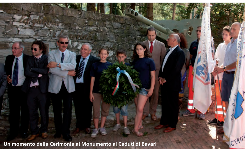
Un momento della Cerimonia al Monumento ai Caduti di Bavari