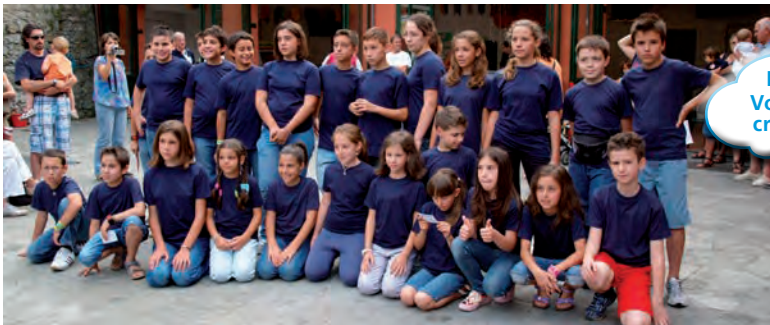
Piccoli Volontari crescono