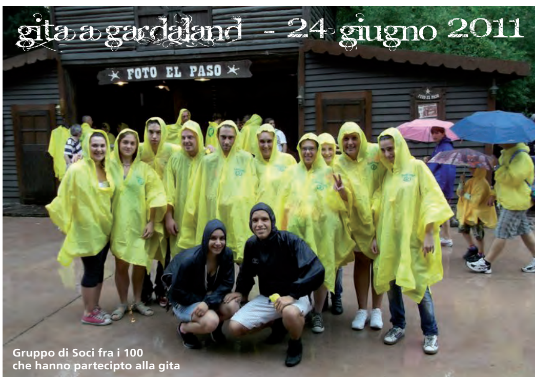
Gruppo di Soci fra i 100 che hanno partecipato alla gita