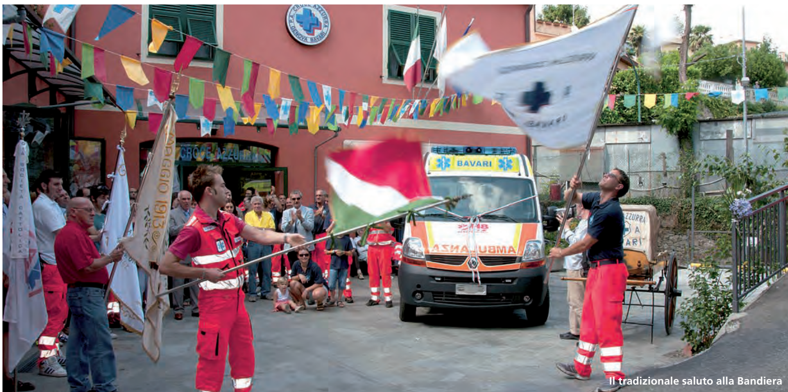
Il tradizionale saluto alla Bandiera