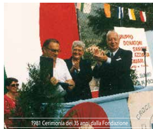
1981 Cerimonia dei 35 anni dalla Fondazione

E' proprio in quegli anni che il senatore riceve la nomina a socio onorario della Croce Azzurra: e nonostante la sua lunga consuetudine ai riconoscimenti e alle onorificenze, non manca di fregiarsi di questo titolo con particolare orgoglio. Il suo affetto per Bavari (che risale ai tempi dell'infanzia), la sua attenzione per la cittadinanza attiva e per il servizio volontario e gratuito in favore dei bisognosi, sono ben sintetizzati in una splendida pagina di sapore autobiografico che volle pubblicare proprio sul giornalino della P.A.,