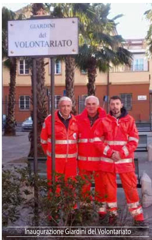
Inaugurazione Giardini del Volontariato

La nostra Croce Azzurra per mezzo dei suoi volontari concretizza i valori della solidarietà, dell'amore verso il prossimo, che ha bisogno di assistenza e di calore umano. Le crescenti esigenze di offrire un servizio pronto ed efficiente richiede l'impegno e l'impiego di un numero sempre maggiore di volontari. Per queste ragioni ti chiediamo di non restare alla finestra, di dare un po' del tuo tempo libero a questo nobile scopo di aiutare gli altri che aspettano la nostra solidarietà. Domani potremmo essere noi ad avere bisogno degli altri.