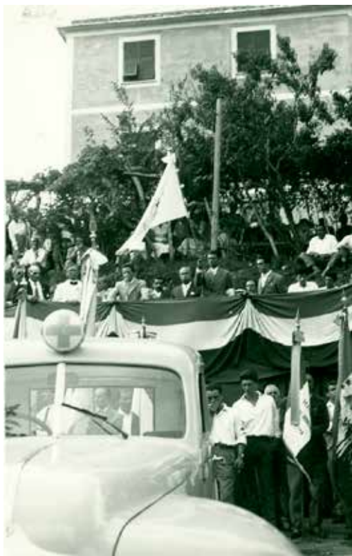
1956 Cerimonia di Fondazione della Croce Azzurra di Bavari

Il rapporto tra l'on. Paolo Emilio Taviani e la Croce Azzurra nasce con l'associazione stessa. Nel 1956, allorché la Pubblica Assistenza bavarese vede la luce, l'allora ministro della Difesa è, con l'amico/avversario Gaetano Barbareschi, fra le autorità che tengono a battesimo la neonata associazione e il suo primo automezzo di soccorso. È di lì, fra l'altro, che trae origine un più che quarantennale rapporto di reciproca stima con il dott. Luigi Raschi.