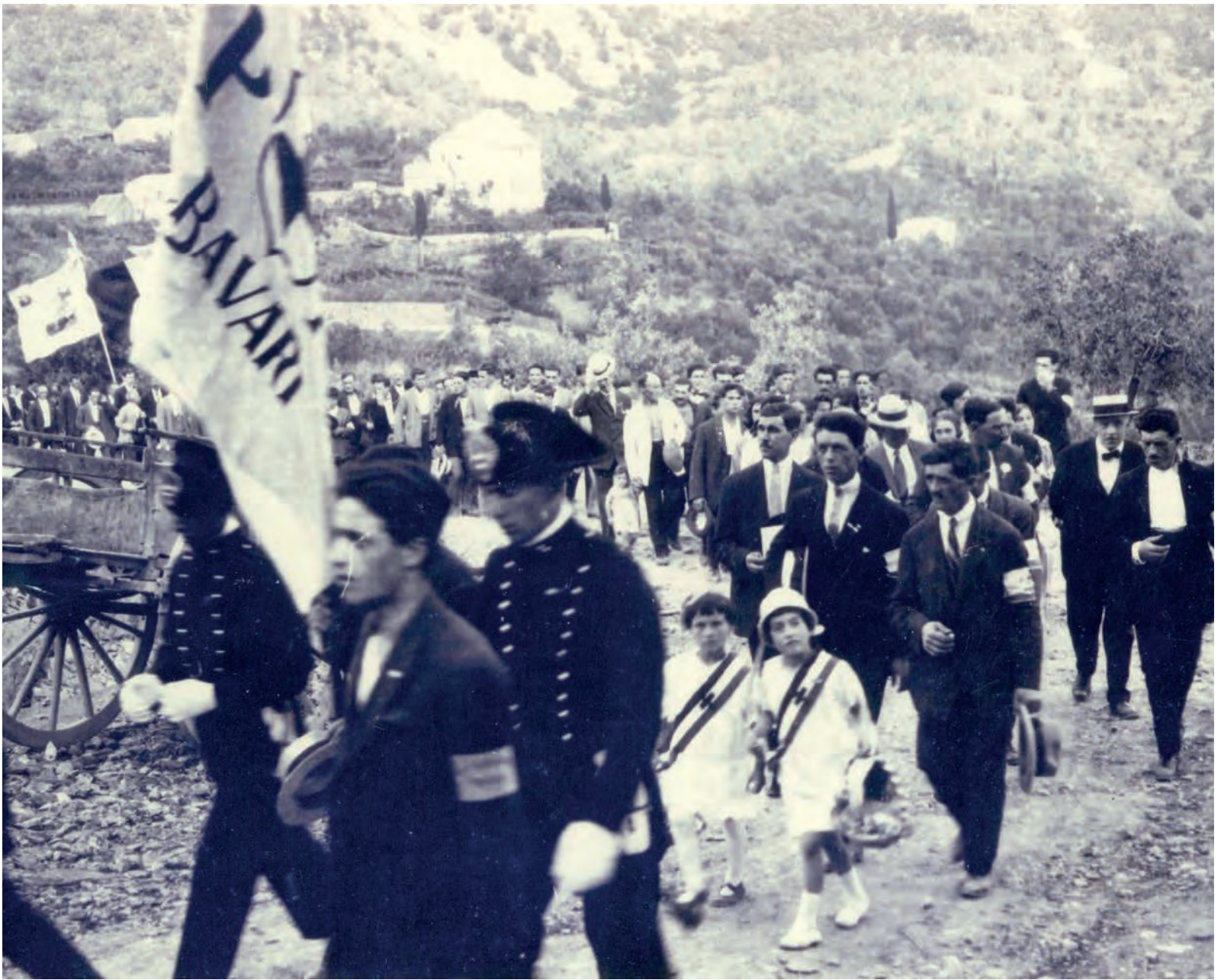
BAVARI 1926 Cerimonia di Fondazione della Croce Verde di Bavari