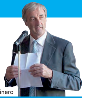
di Mario Mainero

Per parlare un po' degli ultimi avvenimenti, da registrare in questo ultimo quinquennio la nascita del " Gruppo Giovani " e del " Gruppo di Protezione Civile ". Quest'ultima iniziativa va ad