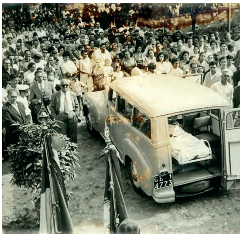
BAVARI 1956 Cerimonia di Fondazione della Croce Azzurra di Bavari