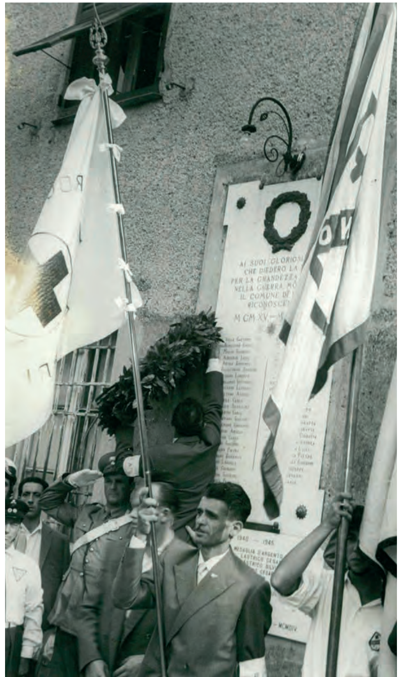
BAVARI 1956 Cerimonia di Fondazione della Croce Azzurra di Bavari