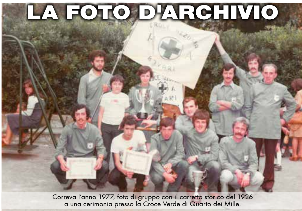
Correva l'anno 1977, foto di gruppo con il carretto storico del 1926 a una cerimonia presso la Croce Verde di Quarto dei Mille.