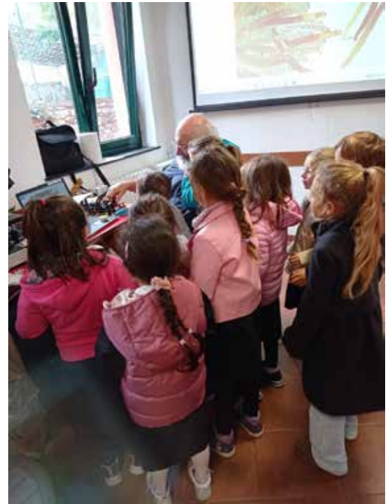
Le scolaresche in visita alla mostra